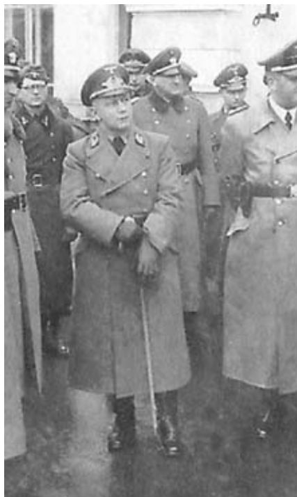
Гауляйтер Белоруссии Вильгельм Кубе (в центре)