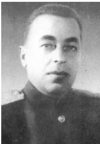
Генерал—майор М. И. Баскаков. Начальник Карельского штаба партизанского движения