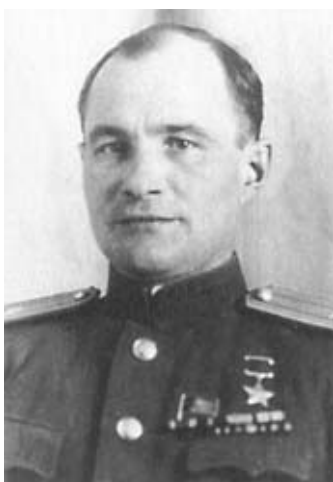
Герой Советского Союза Д. В. Емлютин. Организатор партизанского движения в Орловской области