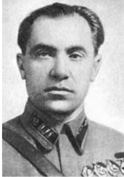
Герой Советского Союза В. А. Лягин