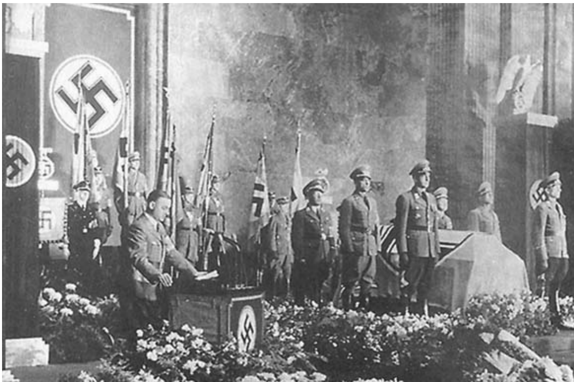
Похороны В. Кубе. С речью выступает А. Розенберг