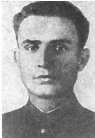
Герой Советского Союза Л. Паперник