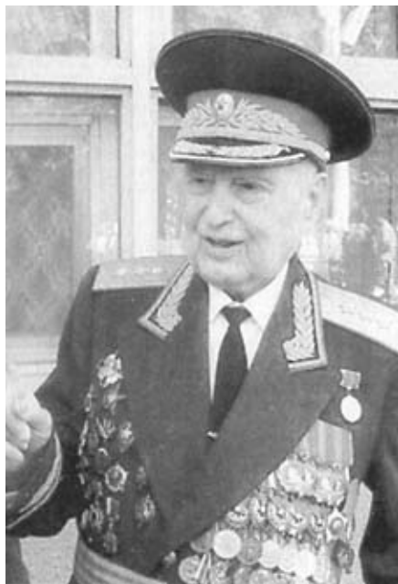
Генерал—полковник С. С. Бельченко. 9 мая 2001 года. Стадион «Динамо», г. Москва