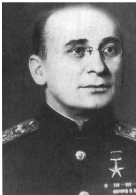
Л. П. Берия. Народный комиссар внутренних дел