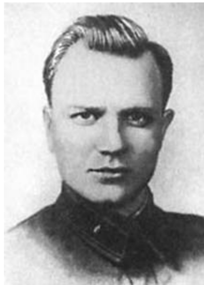
Герой Советского Союза В. А. Молодцов