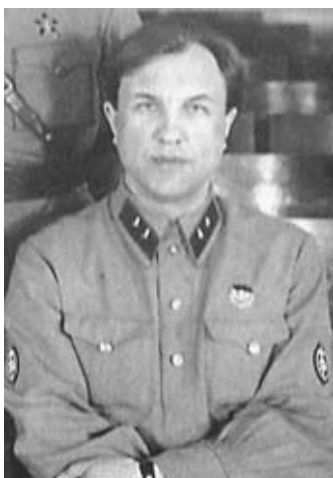
В. С. Абакумов. Начальник контрразведки СМЕРШ