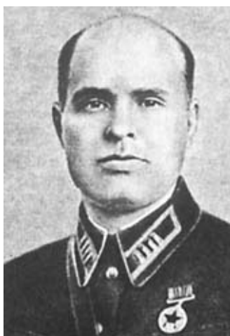
М. Ф. Орлов. Командир ОМСБОН НКВД СССР