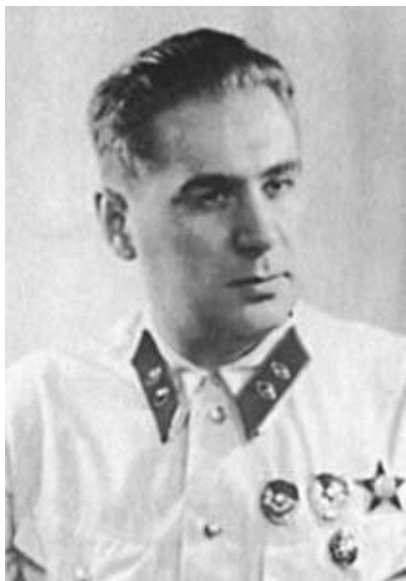
П. А. Судоплатов. Начальник 4-го Управления НКВД— НКГБ СССР