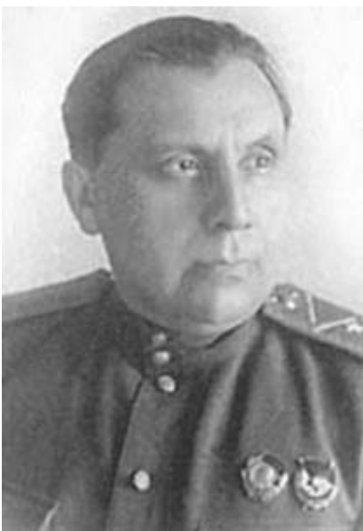
Н. И. Эйтингон. Заместитель начальника 4-го Управления НКВД—НКГБ СССР