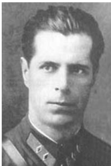
Герой Советского Союза Н. И. Кузнецов. Агент—боевик отряда «Победители»