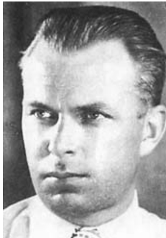
В. Г. Старинов. Помощник начальника ЦШПД по диверсиям