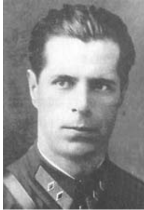
Герой Советского Союза Д. Н. Медведев. Командир отрядов «Митя» и «Победители»